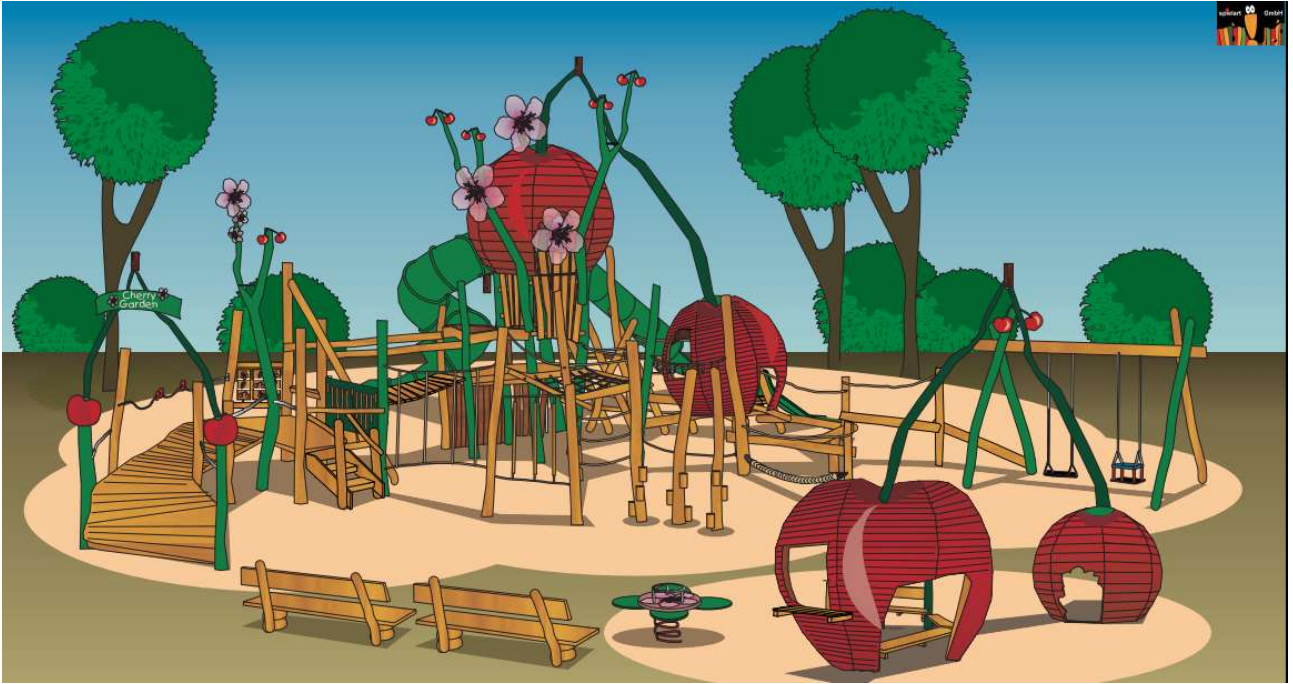
Leikkivälineiden tuotekuvat / Spielart