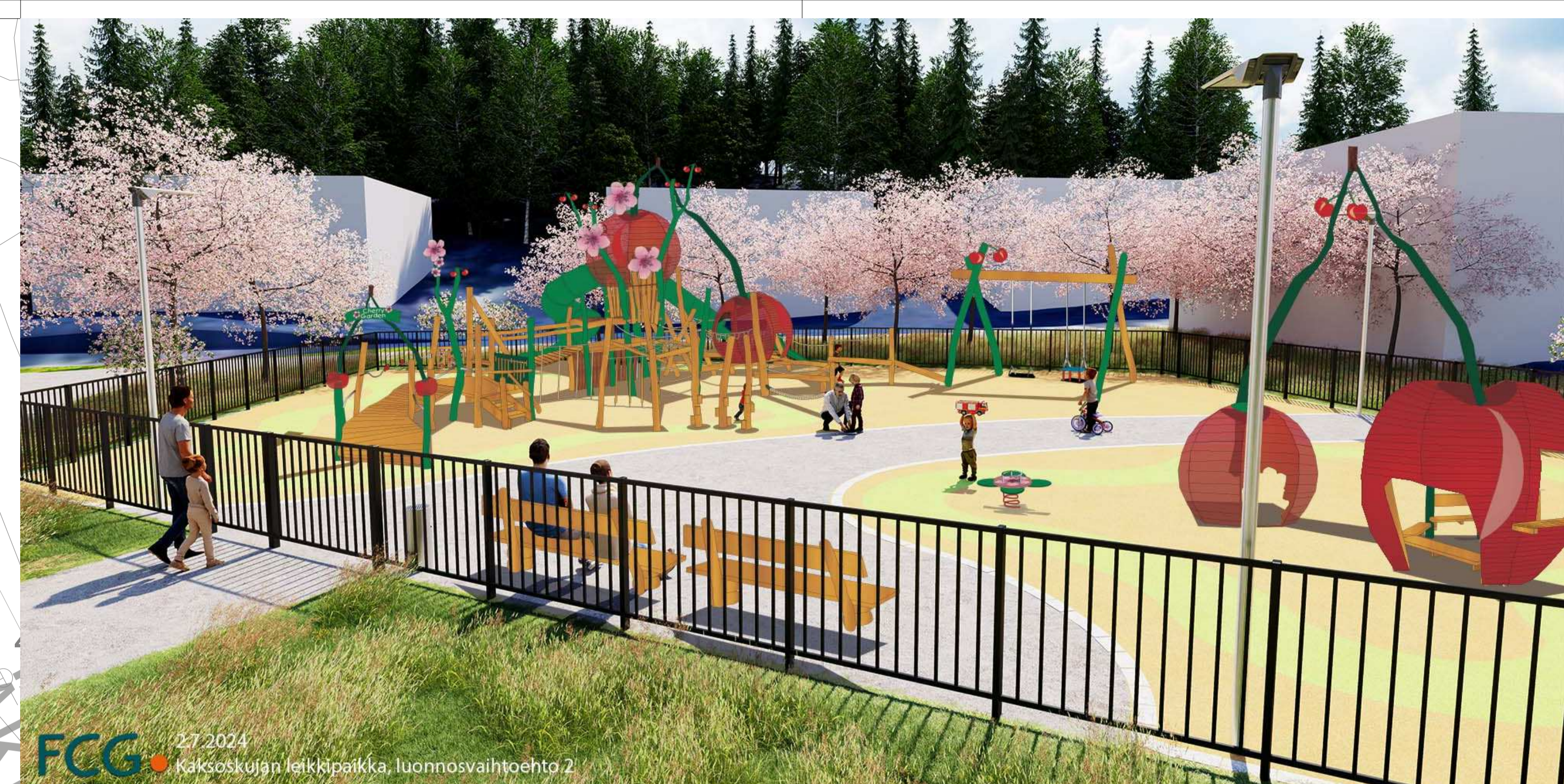
FCG 27.2024 Kaksosmäen leikkipaikka, luonnosvaihtoehto 2