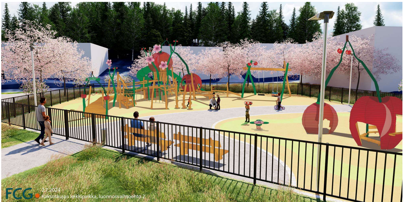
Havainnekuva puistosta Kaksosmäen suuntaan / Mika Rieki, FCG Oy

Puistokäytävien linjaukset pysyvät ennallaan. Nykyisten nurmialueiden yhteydestä kaadetaan muutama puu, suuremmat puuryhmät säilytetään. Puistoa ympäröiville nurmialueille istutetaan runsaasti koristekirsikkaa, rusokirsikkaa sekä kuriilienkirsikkalajikkeita. Vanhan rantatien viereiselle sivulle istutetaan suurikokoisia lehti- ja havupuita luomaan tuulensuojaa.