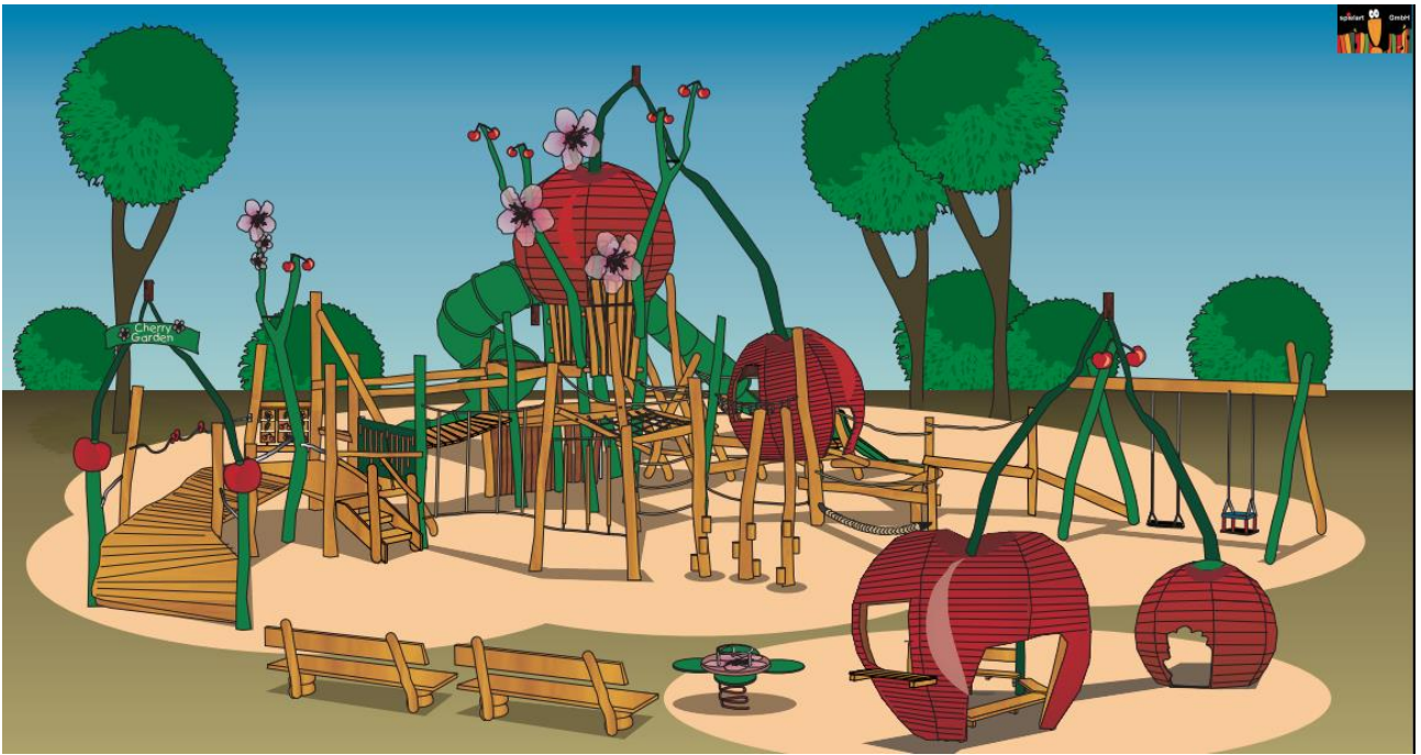
Produktbilder på lekredskapen / Spielart