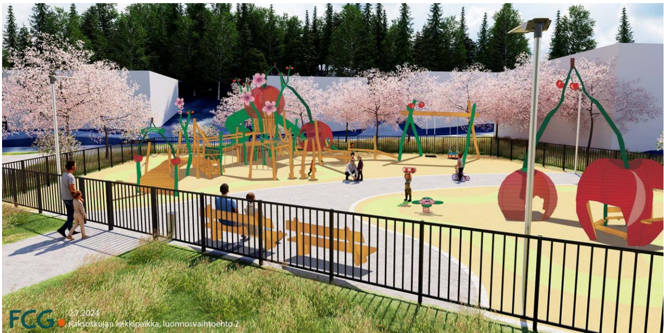
Illustration från parken i riktning mot Tvillingsbacken / Mika Rieki, FCG Oy

Utstakningarna av parkkorridorerna förblir oförändrade. Några träd i anslutning till de nuvarande gräsplanerna fälls, de större trädgrupperna bevaras. På gräsområdena som omger parken planteras rikligt med prydnadskörsbär, bergkörsbär och sorter av kurilerkörsbär. På sidan bredvid Gamla Kustvägen planteras stora löv- och barrträd för att skapa vindskydd.