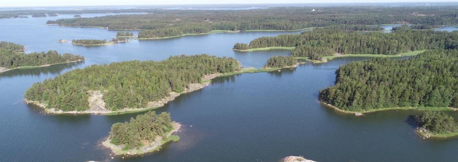
Kuva 3. Kirkkonummen saaristoa ja rannikkoa, etualla vasemmalla Littlon saari ja sen kaakkoispuoleinen pikkusaari ja oikealla Linlon saarta, taustalla Haukipäätä ja Upinniemeä.