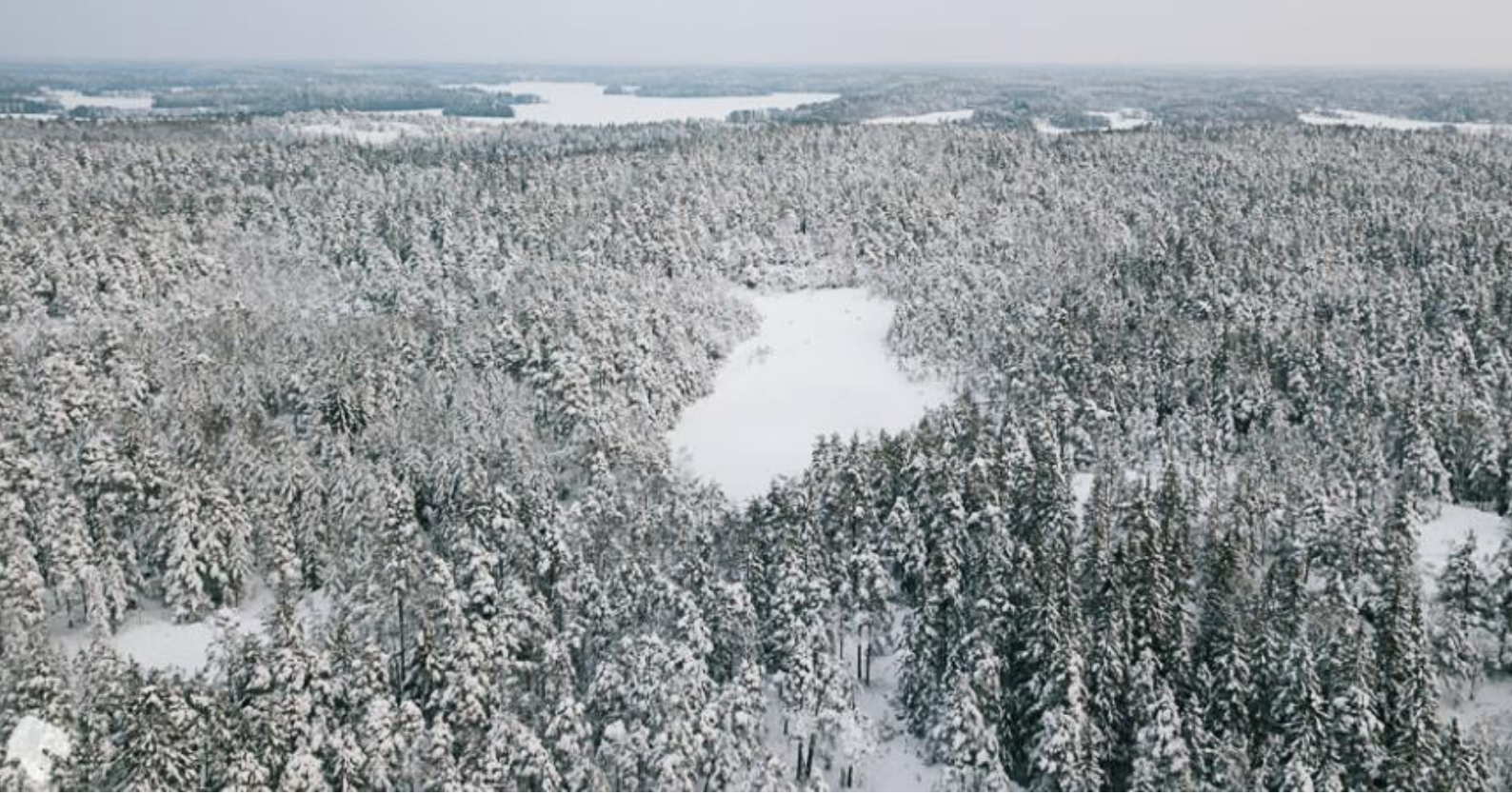
Kuva 4. Meikon aluetta, jonka metsät edustavat monia luontodirektiivin luontotyypppejä ja uhanalaisiksi arvioituja luontotyypppejä. Etualan lampi Kakarlampi, taustalla Humaljärveä.