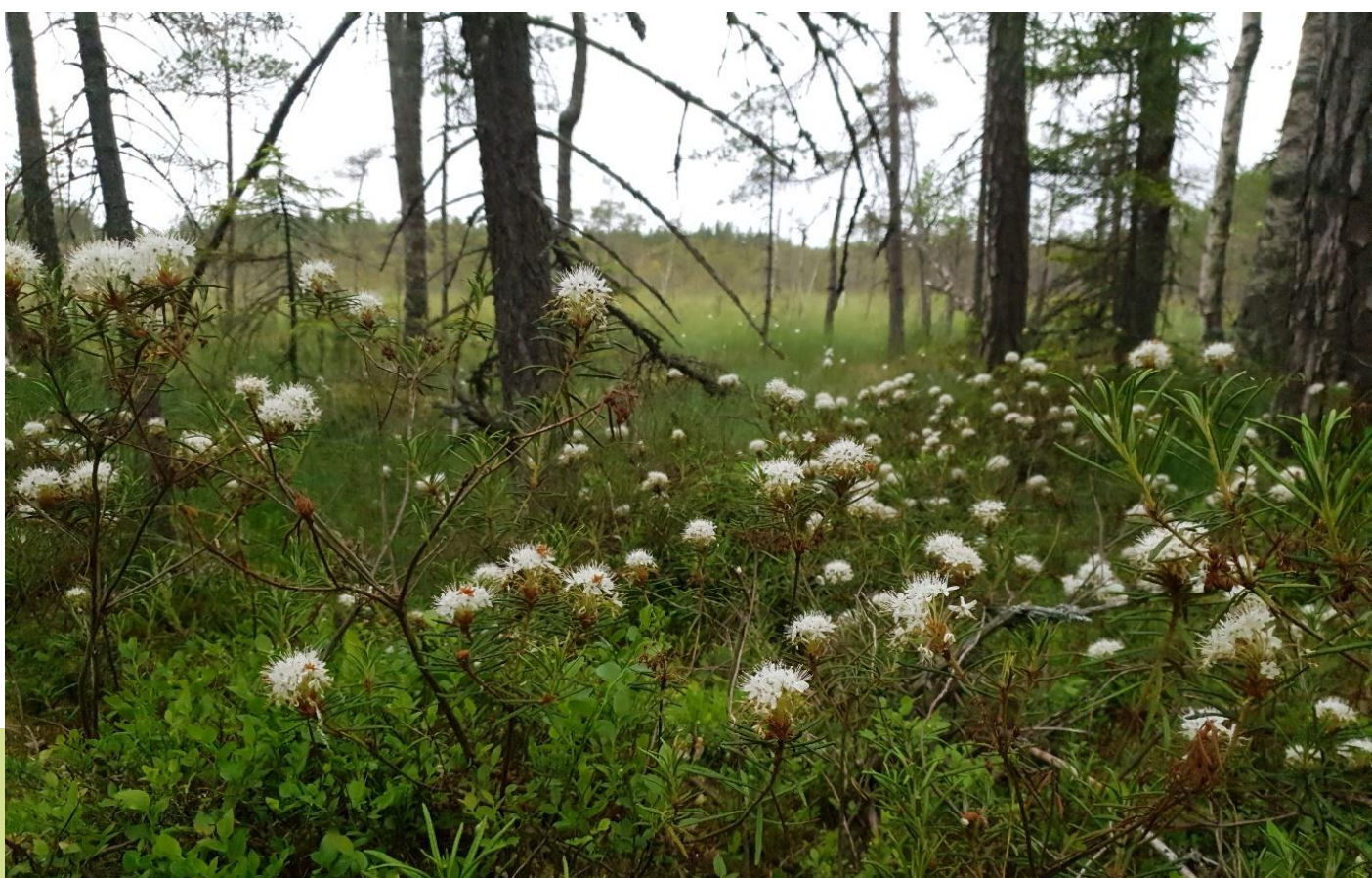
Kuva 7. Stormossenin keidassuo eteläisellä Kirkkonummella edustaa uhanalaisia laakiokkaita. Keidassuot koostuvat useiden suotyyppien alueista, kuvassa etualalla isovarpurämettä ja taustalla nevaa.

Yleisimpiä soiden pääluontotyyppejä Kirkkonummella ovat erilaiset korvet ja rämeet. Nevat ovat etupäässä pieniä laikkuja korprien ja rämeiden reunustamana. Luhtia on etenkin meren ja järvien rannoilla.