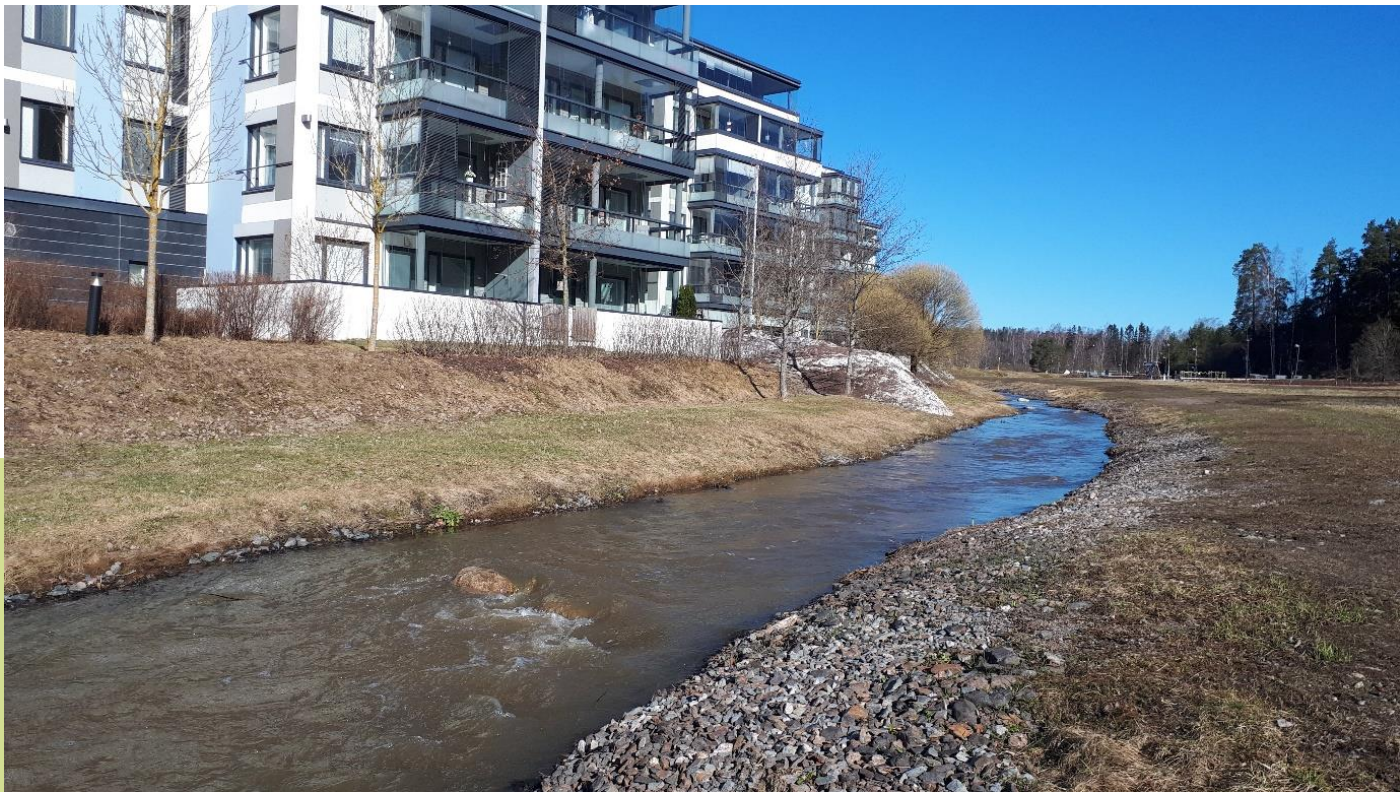
Kuva 8. Jolkbyån-puroa Kirkkolaaksossa Kirkkonummen keskustassa. Uomaa on siirretty rakentamisen alta 2000-luvun alussa. Tällöin uoman pohjalle laitettiin särmikästä louhetta, joka ei sovellu vaelluskalojen liikkumiselle. Jolkbyånin uomaa on sittemmin kunnostettu Virtavesien hoitoyhdistys ry:n ja Kirkkonummen ympäristöyhdistys ry:n sekä talkoolaisten toimesta.

Mankinjoen ja Siuntionjoen vesistöissä on säilynyt geneettisesti alkuperäinen meritaimenkanta, mutta meritaimenen esiintymisalueita ei tällä hetkellä ole Kirkkonummen puolella.