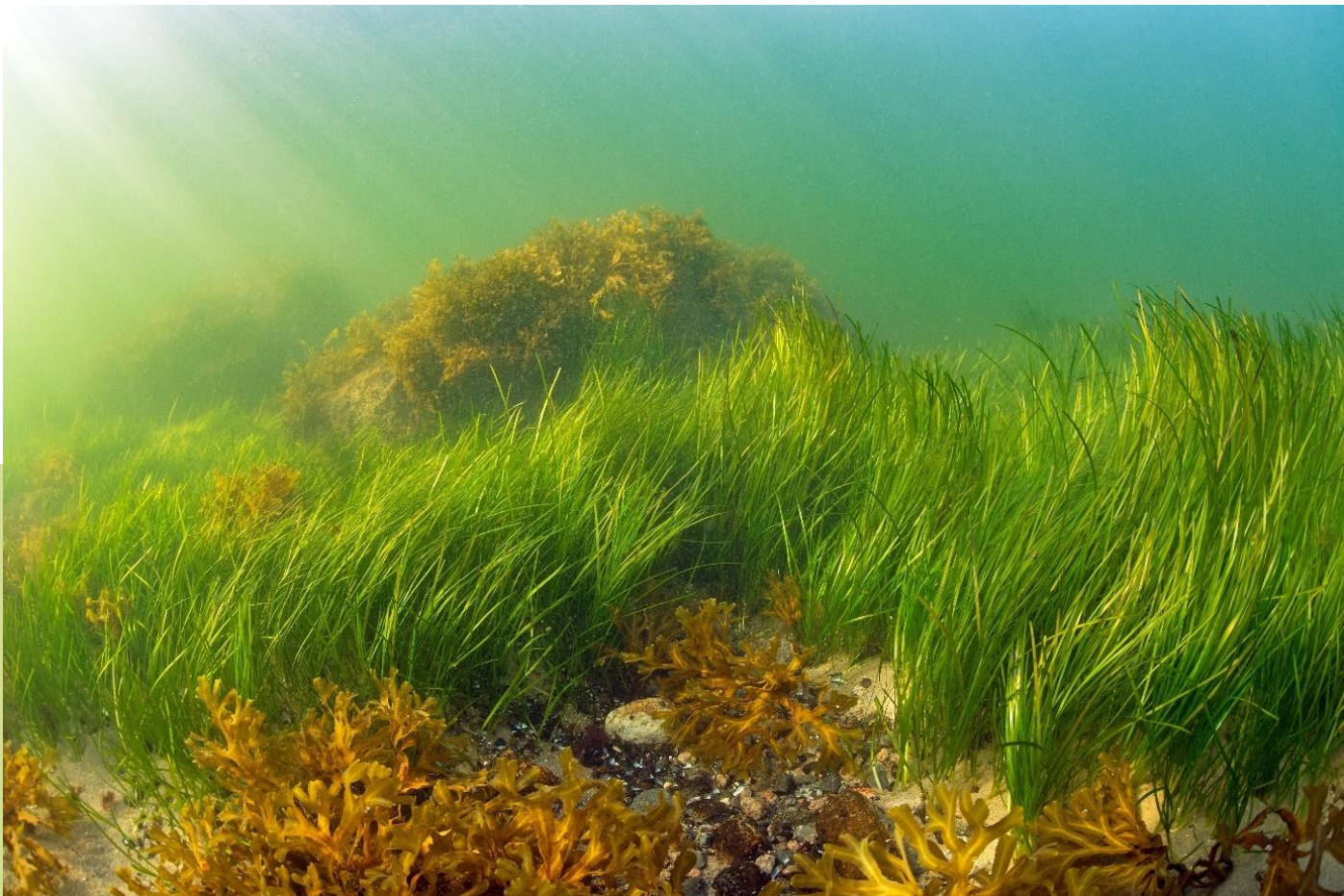
Kuva 5. Meriajokasniityt ja rakkohauruyhteisöt tarjoavat suojaa ja ravintoa lukuisille lajeille ja ovat näin hyvin monimuotoisia eliöyhteisöjä.

Monilajiset putkilokasviviidakot, hiekkapohjien meriajokasniityt, kalliorantojen erilaiset leväyhteisöt ja pimeämmillä kalliopohjilla suodattavat sinisimpukkayhteisöt ovat arvokkaita paitsi sellaisinaan, myös estäessään Itämeren tilan heikentymistä ravinteiden pidätyksen kautta.