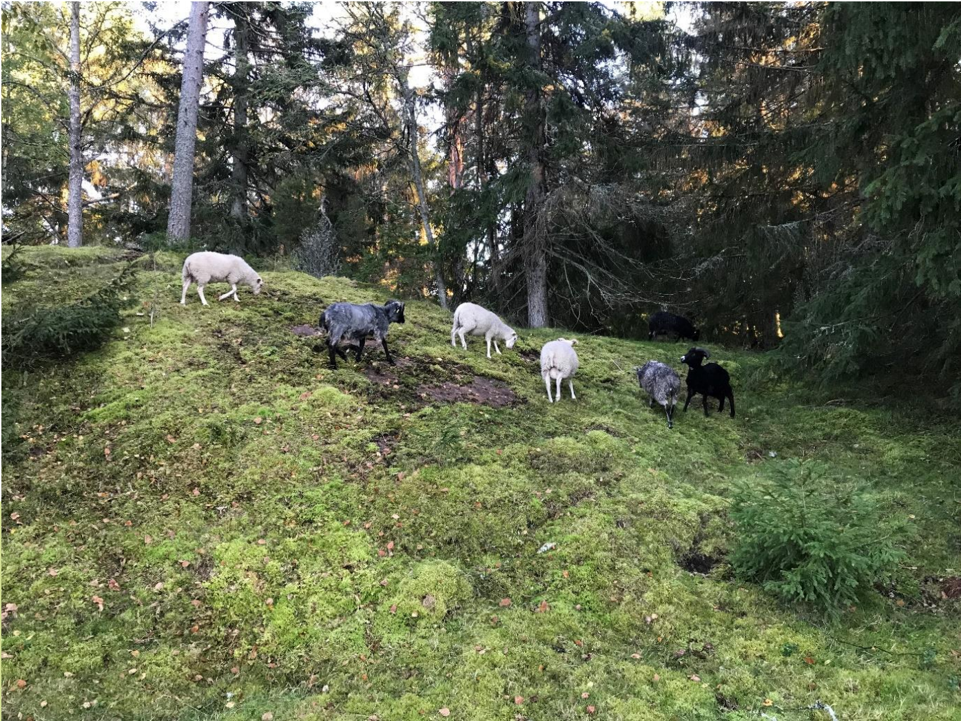
Kuva 9. Lampaat laiduntamassa kunnan omistamalla alueella Porkkalan Lillkanskogin hakamaalla.

Perinneympäristöjen luontotyytit ovat nykyisin koko maassa erittäin uhanalaisia. Kirkkonummellakin perinneympäristöt ovat vähentyneet huomattavasti umpeenkasvun ja rehevöitymisen myötä. Hoidettuja perinneympäristöjä on Kirkkonummella eniten valtion omistamilla rannikon luonnonsuojelualueilla. Kunnan omistamista perinneympäristöistä on hoitotoimien piirissä ollut lähinnä Vetokannaksen luonnonsuojelualueella oleva keto-niittyalue sekä Vrångnäsuddenin luonnonsuojelualueen hakamaa ja metsälaidun. Nämä alueet ovat tällä hetkellä yksityisen toimijan käytössä laidunalueina, kuten myös Lillkanskogissa kunnan omistuksessa oleva niitty ja hakamaa.