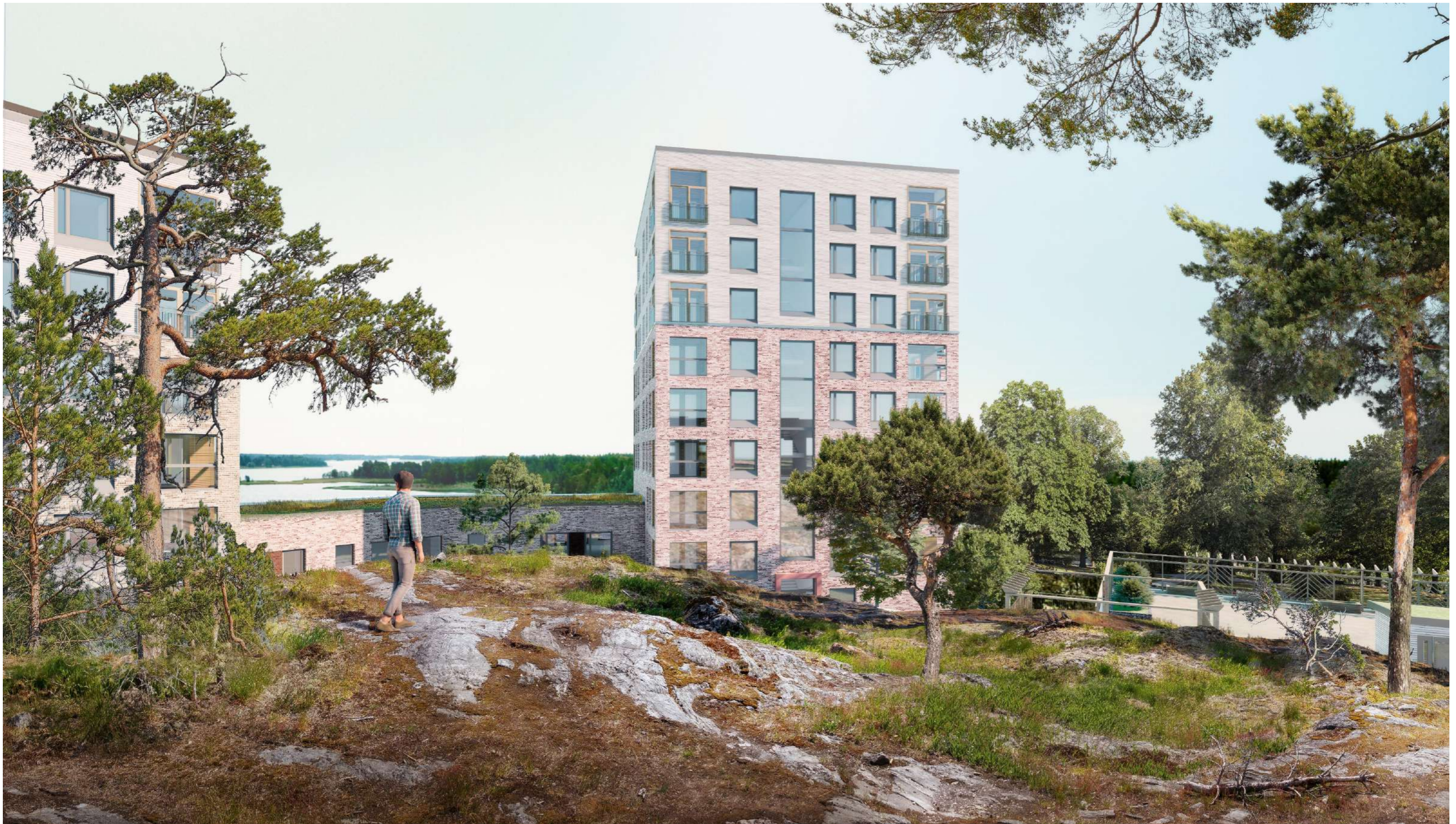
Näkymä 3 - kallion laki korttelin eteläpäässä

Matalaa rakennusmassaa on laskettu sekä lisätty viherkatto.