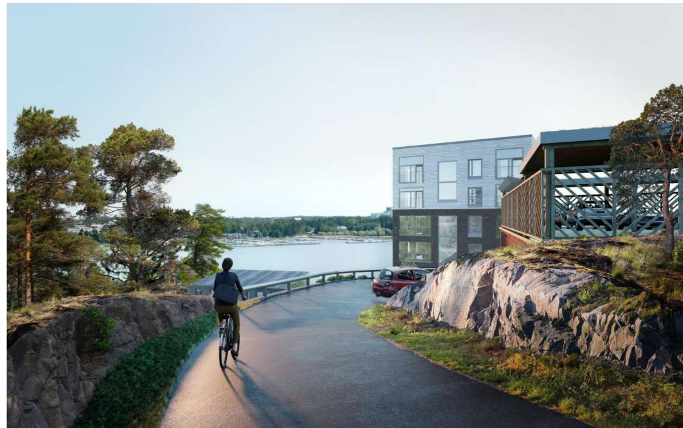
Näkymä 1 - saapuminen AK-korttelin pohjoispäässä