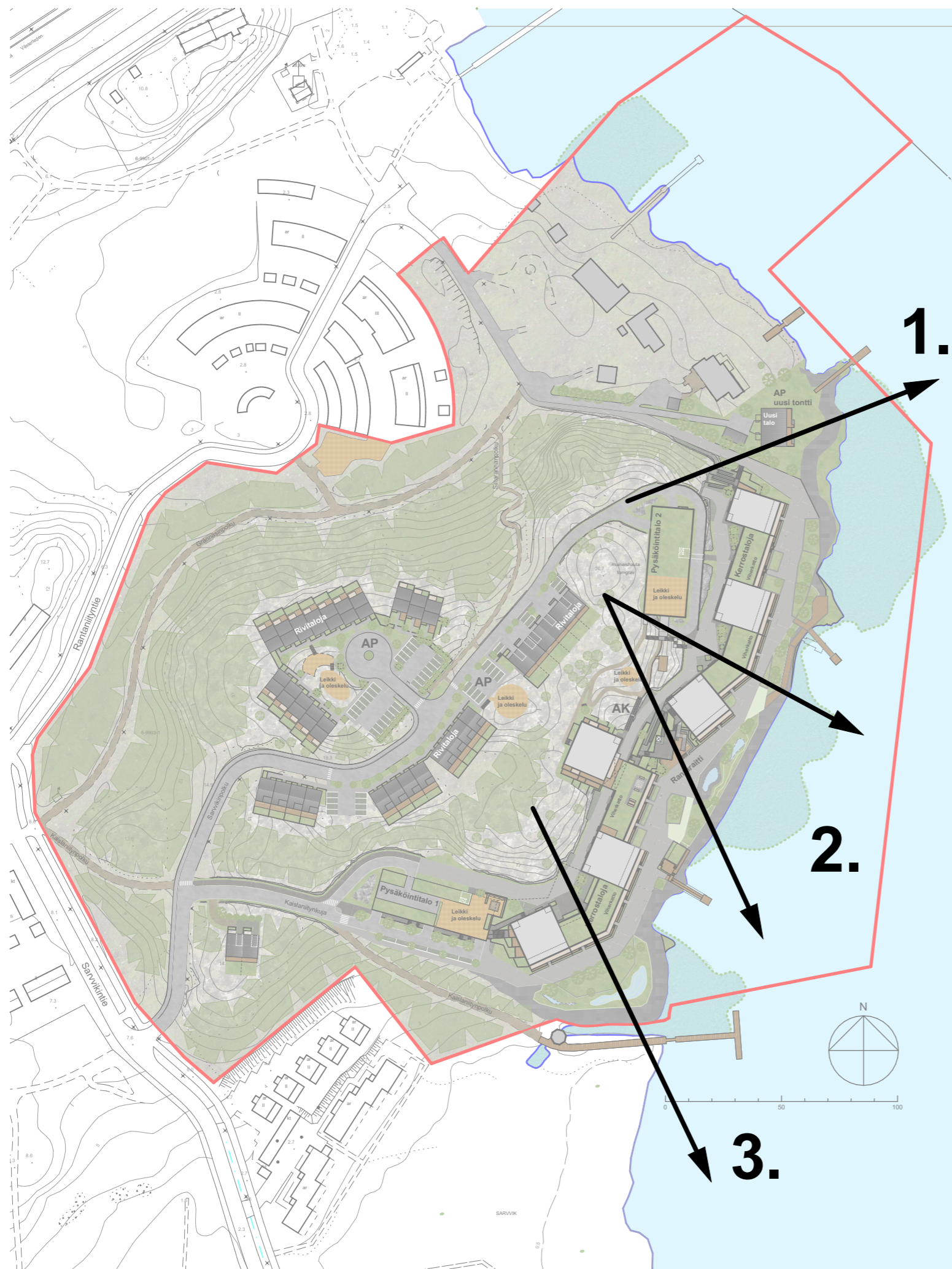
Merinäköalat kallioiden laelta