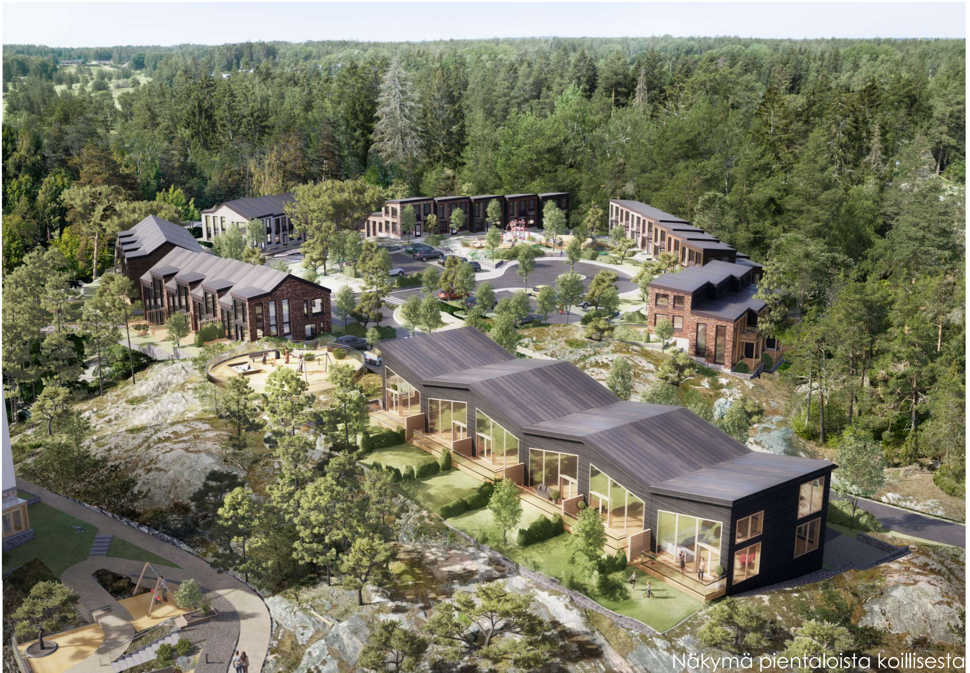
Näkymä pientaloista koillisesta