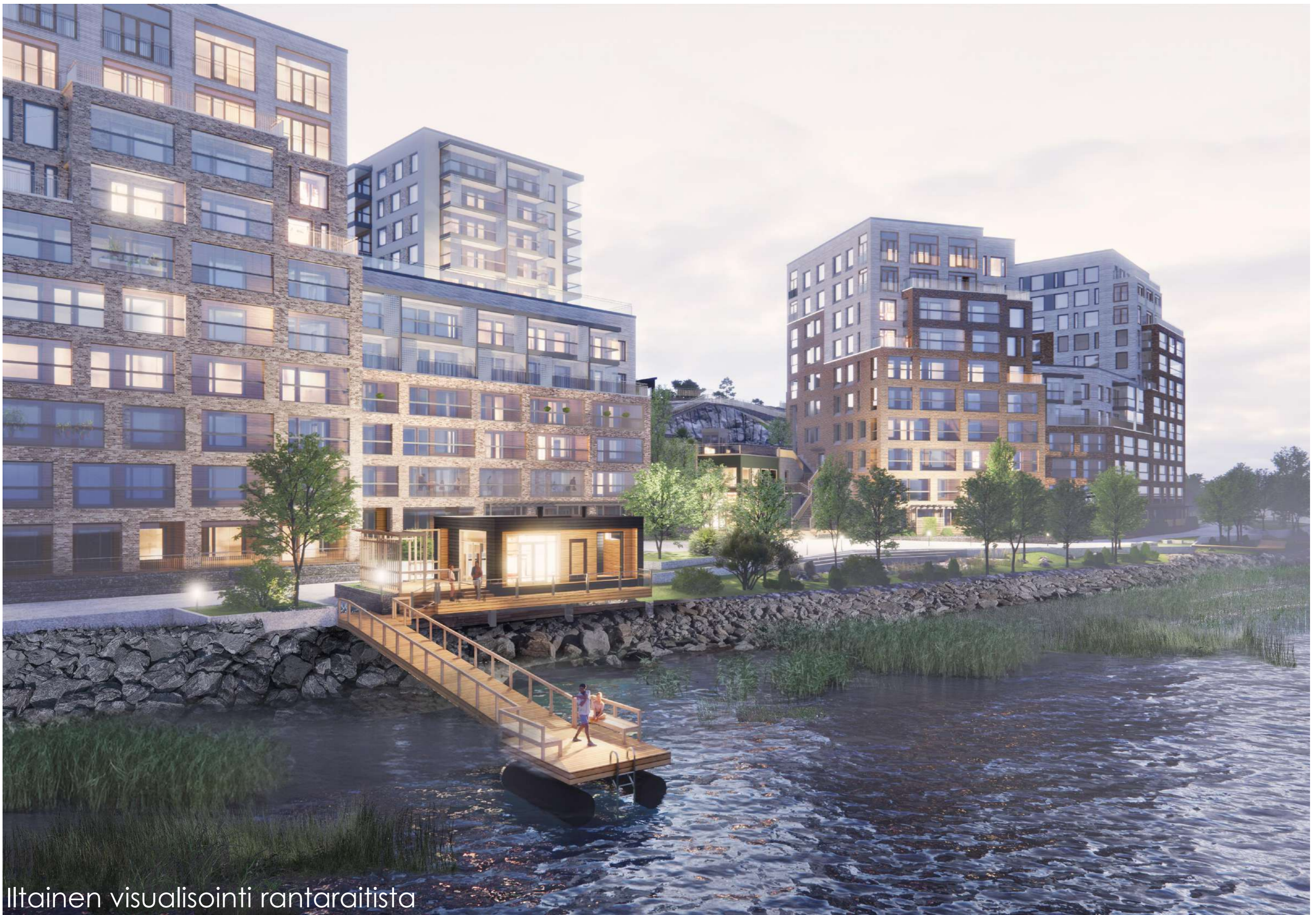
Iltaisen visualisointi rantaraitista