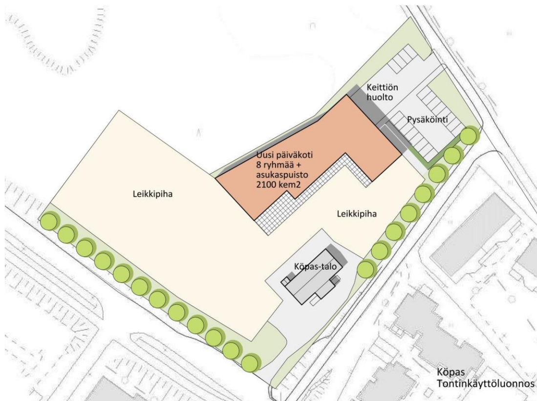
Kuva 2. Alustava uuden päiväkodin tontinkäyttöluonnos.