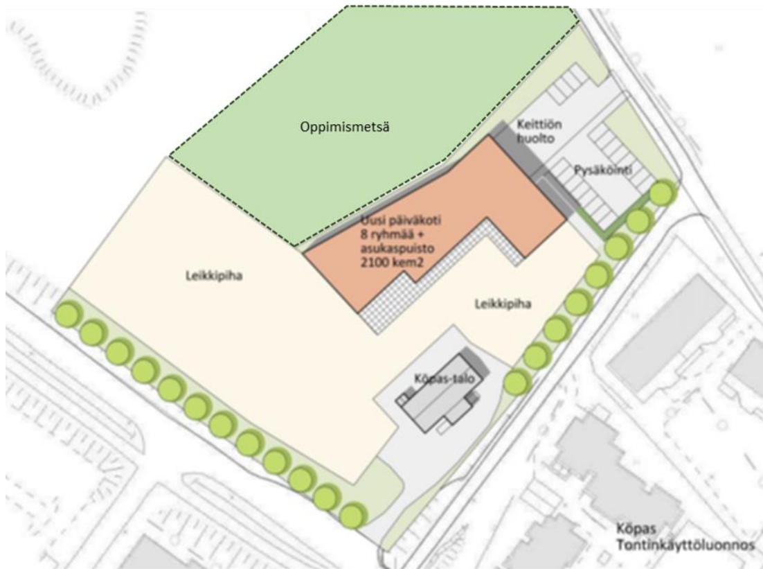
Kuva 1: Kaavamuutoksen mahdollistama tontinkäyttöluonnos Köpaksen tontista

Köpaksen tontti on monimuotoinen ja sijaitsee luonnonmukaisen metsäalueen välittömässä läheisyydessä. Hankesuunnitteluvaiheessa tutkitaan myös mahdollisuus liittää osa luoteisesta VU-alueesta hankkeeseen. Tällä mahdollistettaisiin luonnonmukainen, turvallinen ja toiminnallinen oppimismetsäalue päiväkodin käyttöön. Samalla päiväkodin piha-alueet tarjoaisivat myös alueen pienlapsiperheille virikkeellisen ja turvallisen alueen vapaa-ajan käyttöön.