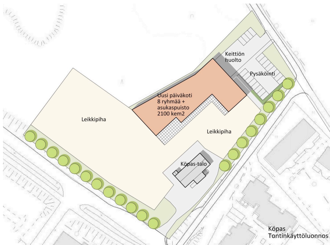
Kuva 2. Alustava uuden päiväkodin tontinkäyttöluonnos.