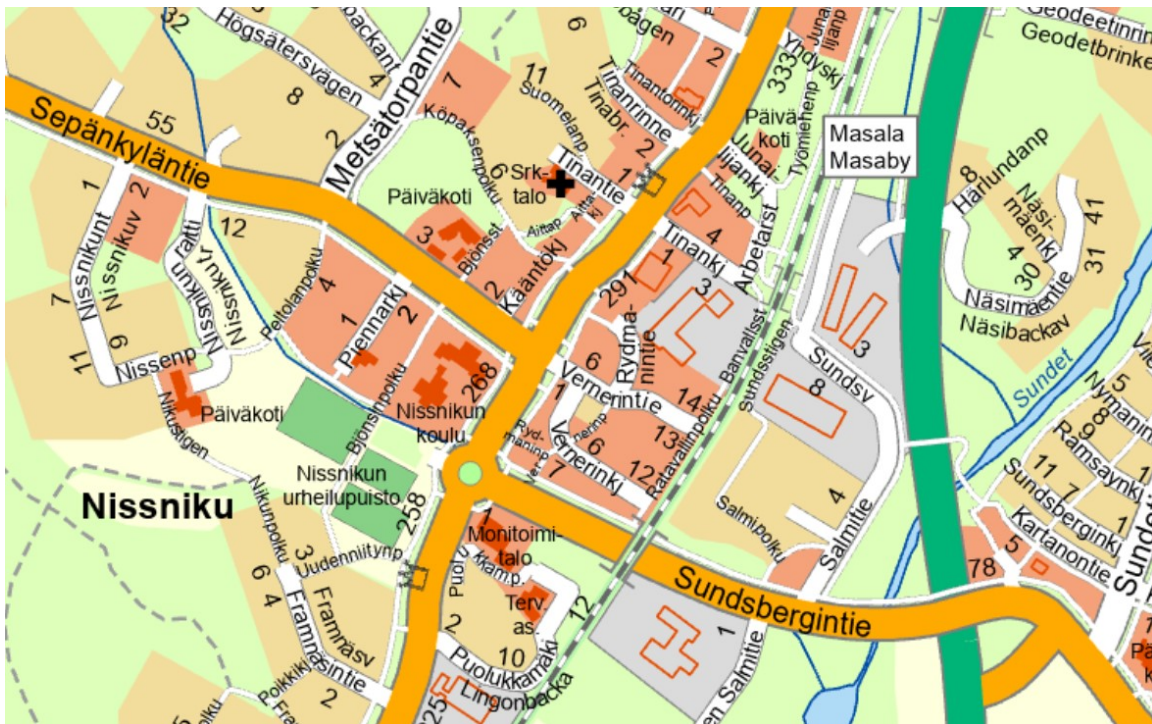
Kuva 1. Masalan alueen uusi päiväkotij sijaitsee keskeisellä paikalla Masalan taajamassa lähivirkistysalueen vieressä entisen Köpaksen päiväkodin tontilla. (lähde: Kirkkonummen karttapalvelu).