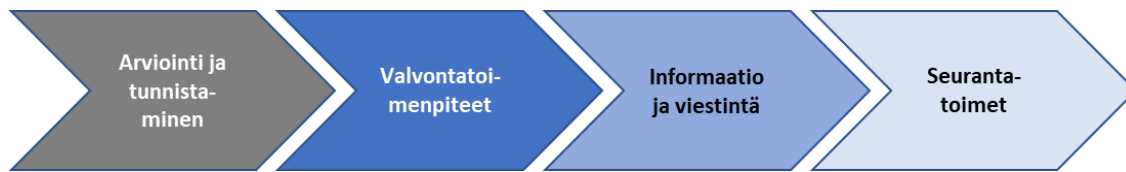
Kuva 2. Sisäisen valvonnan ja riskienhallinnan prosessi

viesti osoitetaan kunnan johdolle sopivalla tavalla, esimerkiksi whistleblowing -kanavan (ilmiannot väärinkäytöksistä) kautta.