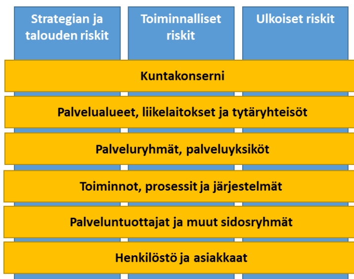
Kuva 4. Riskienhallinnan näkökulmat ja ulottuvuudet

Seuraavassa esitetyt näkökulmat on huomioitava sisäisen valvonnan ja riskienhallinnan järjestämisessä ja toteuttamisessa, päätöksenteossa sekä raportoinnissa.