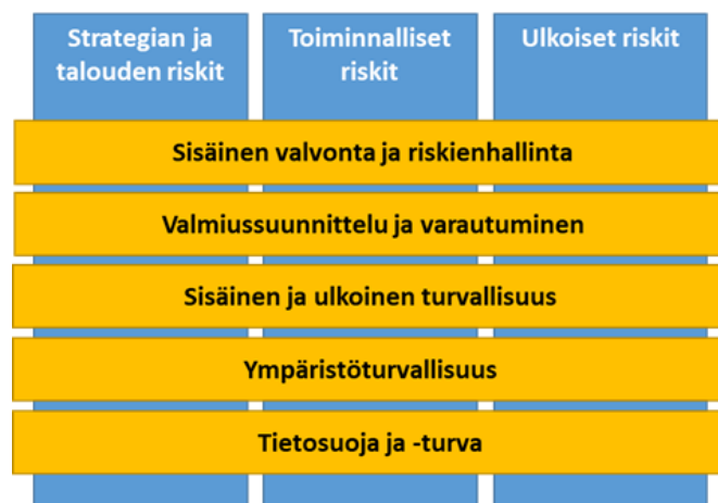
Kuva 1. Kirkkonummen kunnan riskienhallinnan osa-alueet