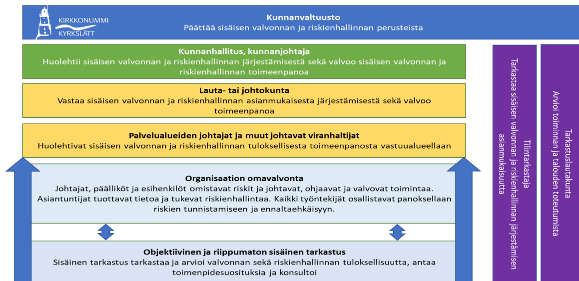
Kuva 3. Kirkkonummen kunnan sisäisen valvonnan ja riskienhallinnan organisaatio

Sisäisen valvonnan ja riskienhallinnan käytännön toteutus, kehittäminen ja seuranta perustuvat organisaatiomukaiseen rakenteeseen. Asemansa ja tehtäviensä mukaan viran- ja toimenhaltijat avustavat kunnan tilivelvollista ylintä johtoa sen sisäisen valvonnan ja riskienhallinnan järjestämistehtävässä. Roolit ja vastuut jakautuvat tehtävittäin seuraavasti kuvan 3 mukaan: