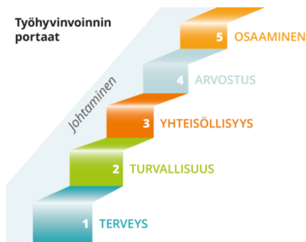
Kuva 1: Työhyvinvoinnin portaat, Työturvallisuuskeskus

Työhyvinvoinnin edistäminen ja työsuojelutoiminta ovat jatkuvia prosesseja, joita toteutetaan, seurataan ja arvioidaan suunnitelmallisesti. Tehokas työsuojelutoiminta on järjestelmällistä ja perustuu työpaikkojen jatkuvaan vaarojen ja riskien arviointiin sekä työsuojelun aktiiviseen yhteistyöhön työyhteisöjen kanssa sekä työhyvinvointikyselyihin ja henkilöstöltä arjessa saatuun palautteeseen.