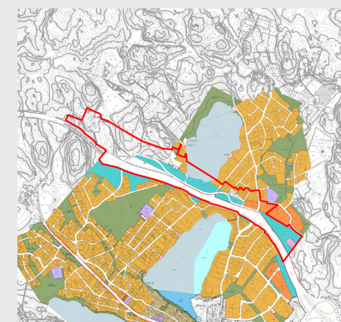
Utdrag av planläggnings situation i närheten