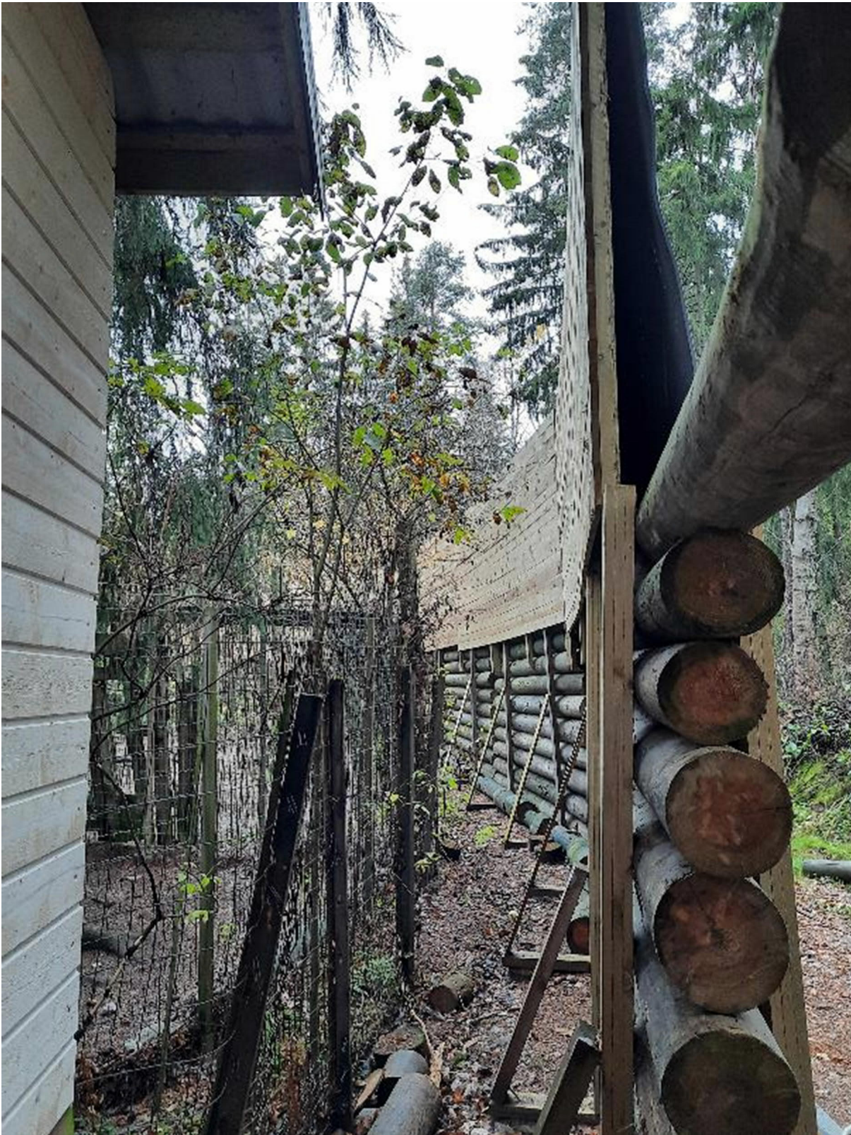
Liite 1. Kuvat 13.10.2021