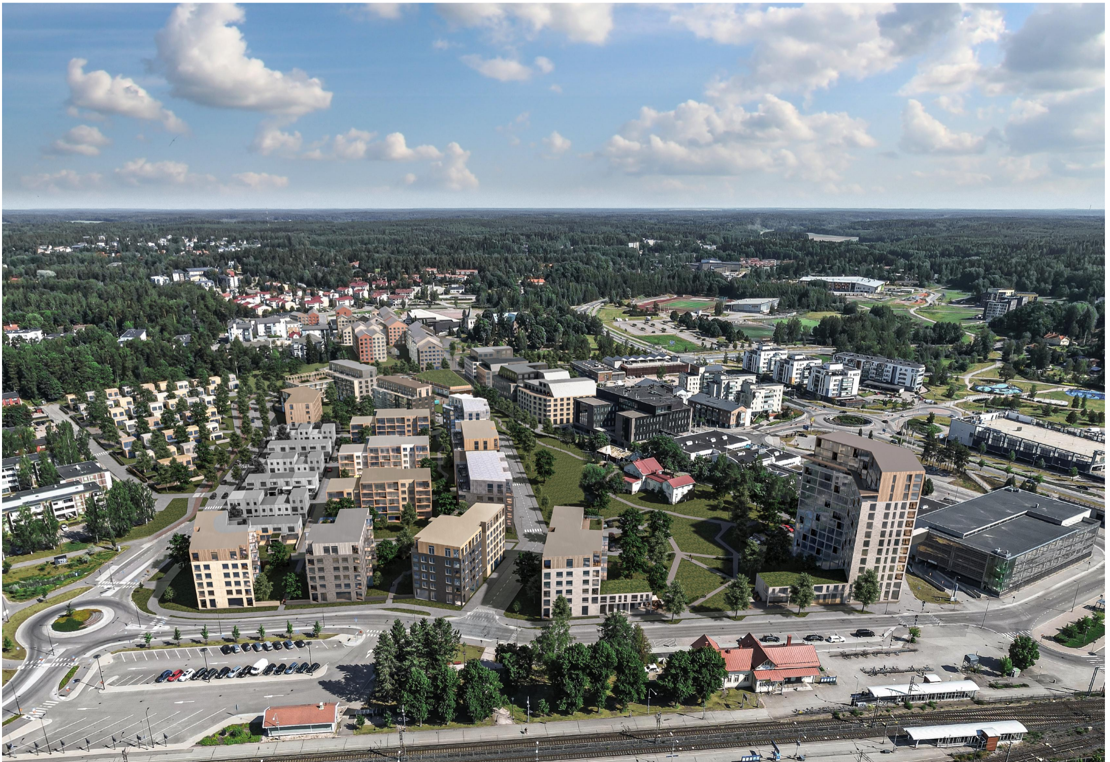
FLYGBILD FRÅN SÖDER