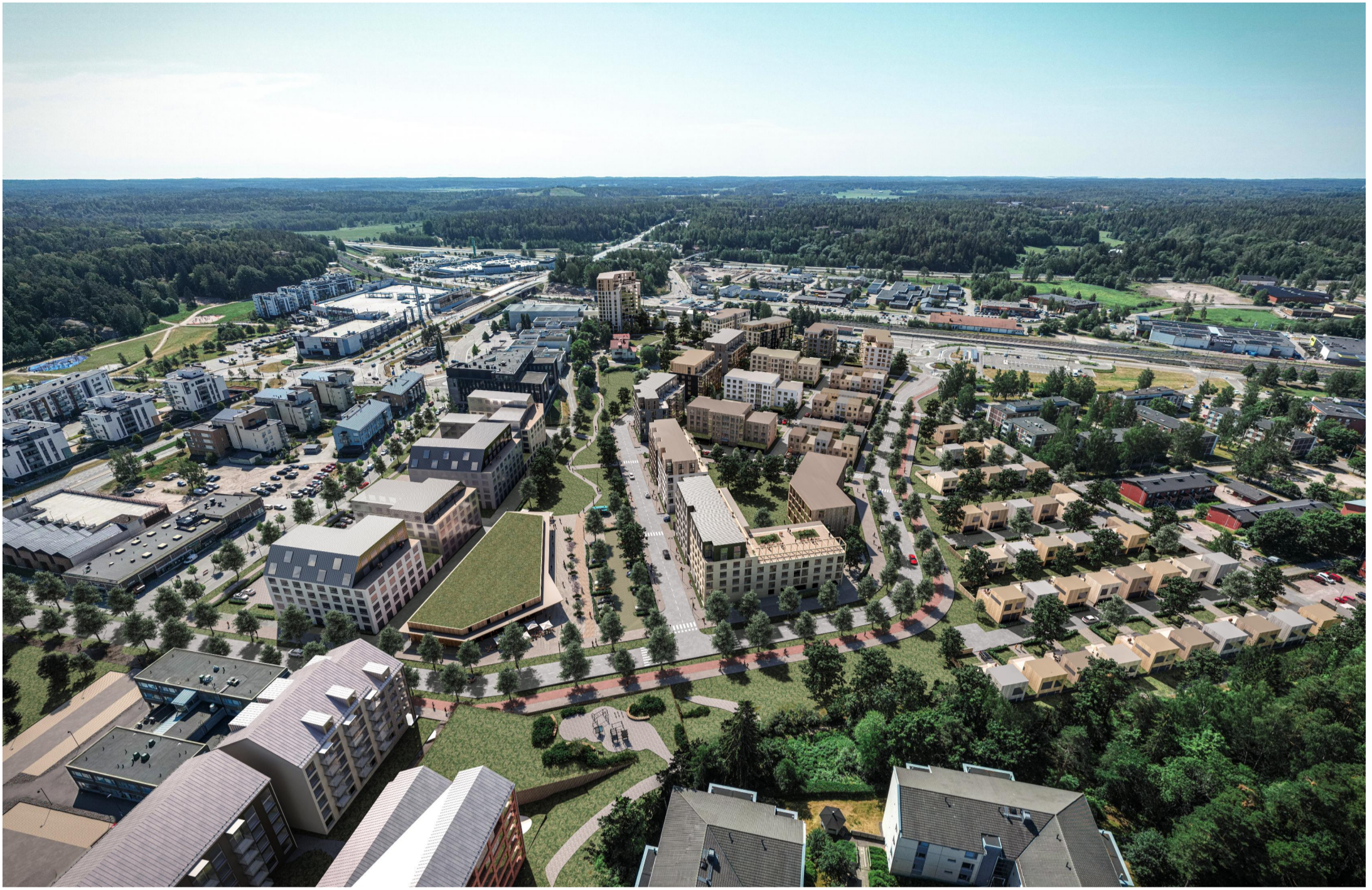
FLYGBILD FRÅN NORR