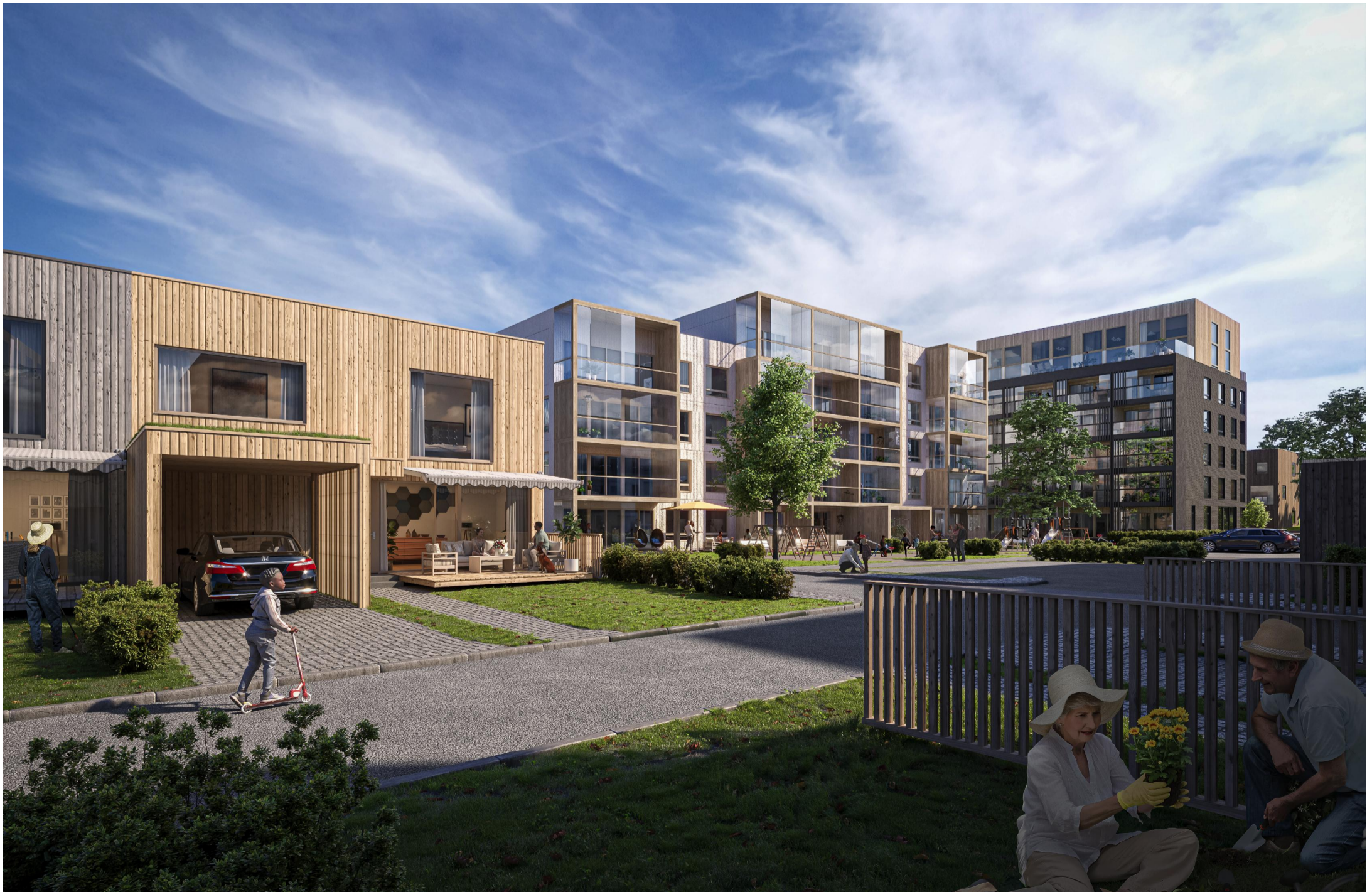
VY FRÅN HYBRIDKVARTERET