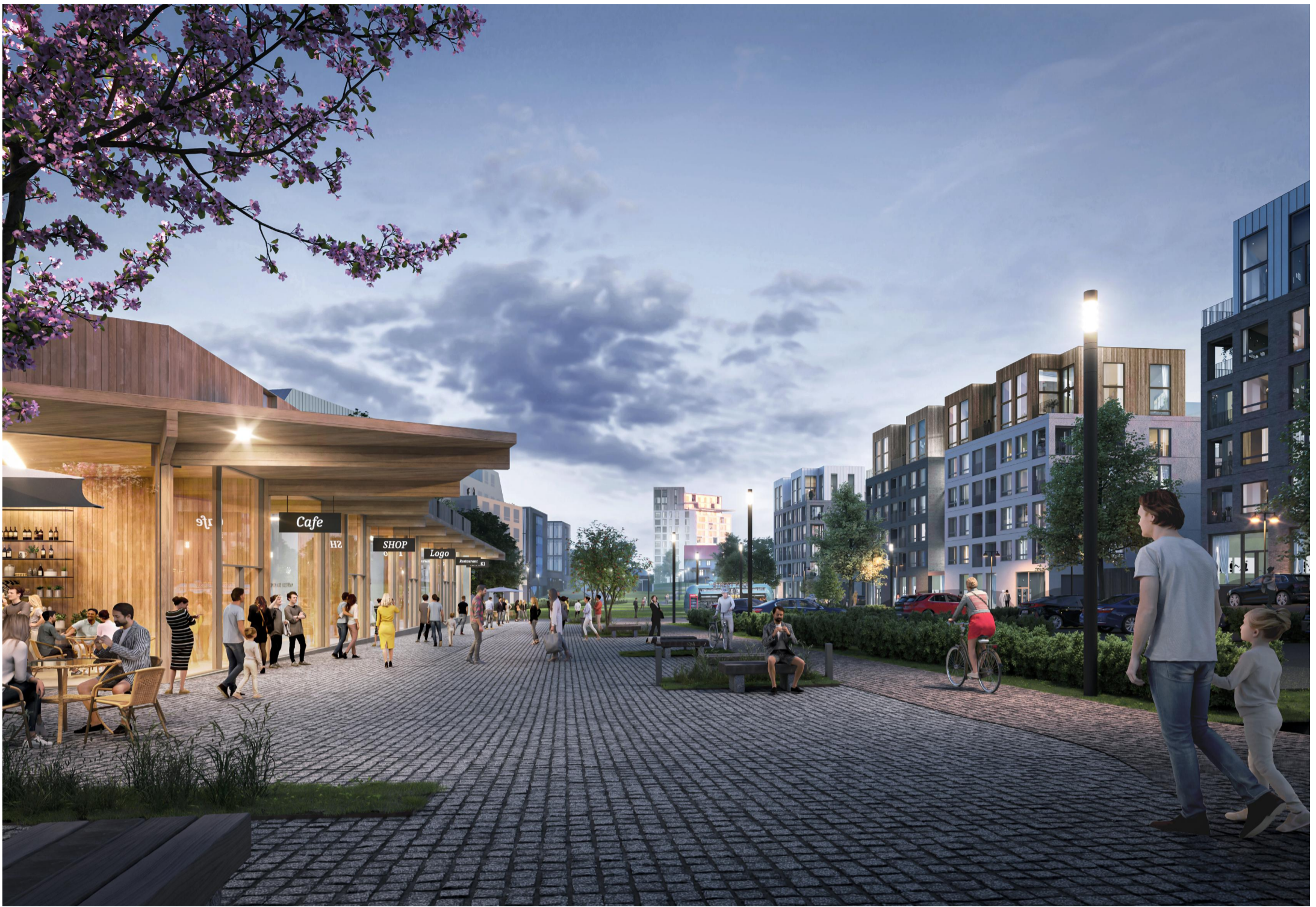
NÄKYMÄ LIIKERAKENNUKSEN PIHASTA ETELÄÄN