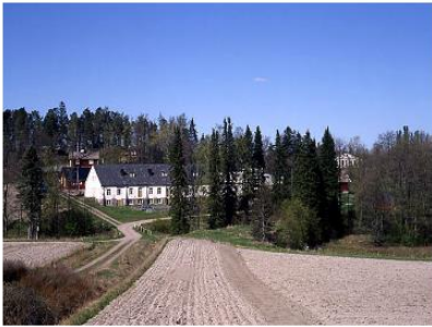
Oitbackan kartanoympäristöä. Soile Tirilä 2000.