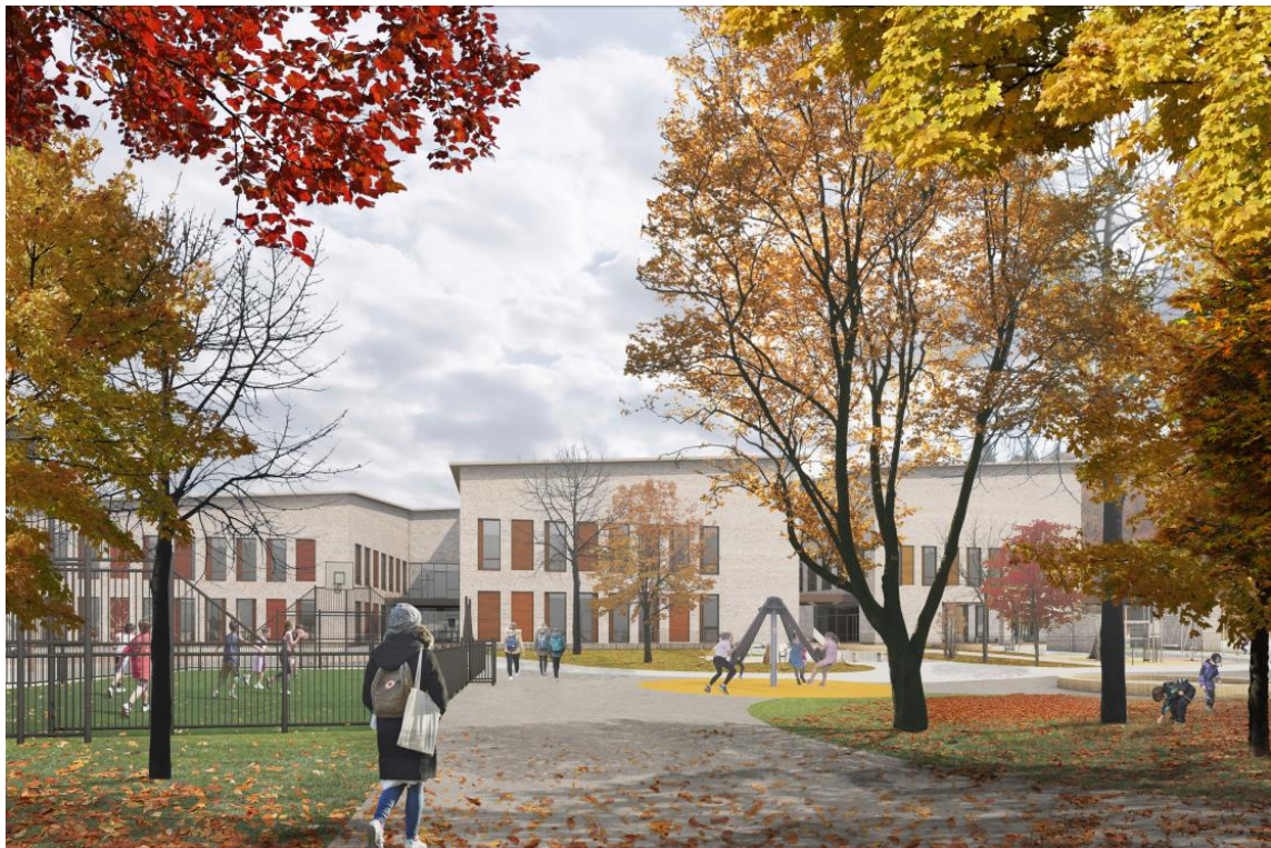
Havainnekuva Gesterbyn koulusta

Kunnanjohtajan esitys Kunnanhallitukselle 3.11.2022