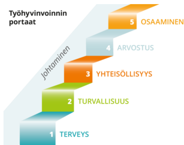
Kuva 1: Työhyvinvoinnin portaat, Työturvallisuuskeskus