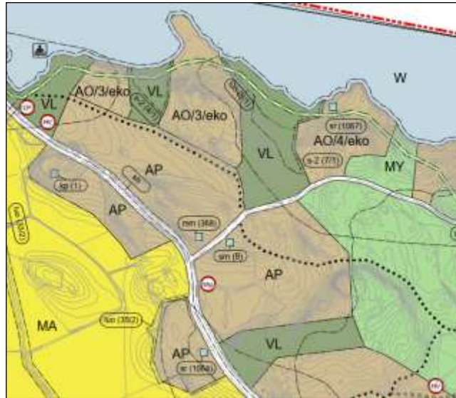
Förslag till delgeneralplan:

Också de allmänna bestämmelserna för områden som ska detaljplaneras har kompletterats enligt följande: "I planeringen av områden som ska detaljplaneras ska verksamhetsförutsättningarna för kollektivtrafik, cykling och gångtrafik beaktas."